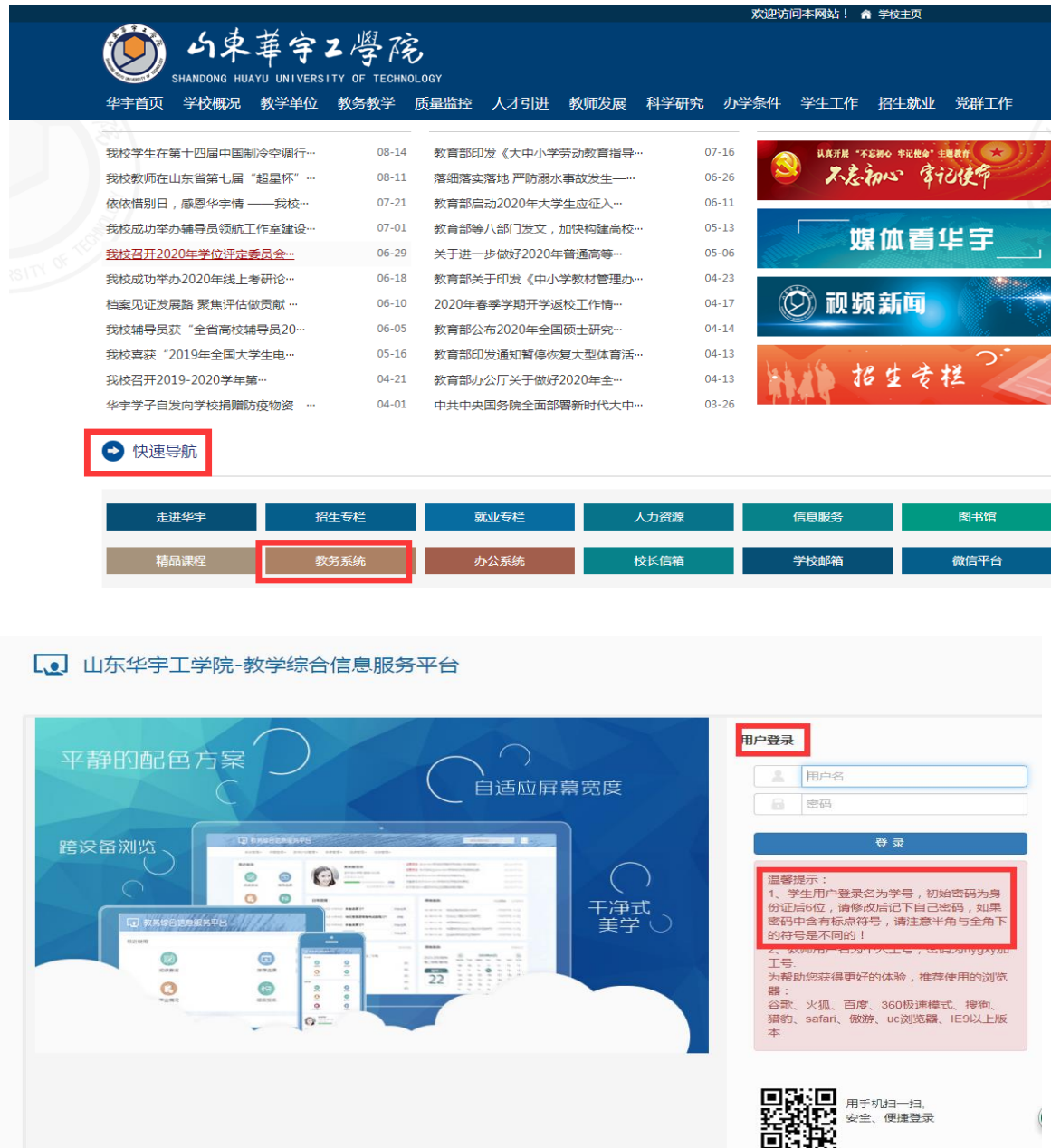
图 1 登陆界面

第一步: 打开 IE 浏览器, 在山东华宇工学院 http://www.sdhyxy.com/ 网站中, 选择教务系统, 点击后进入登陆界面如图 1。输入用户名和密码, 点击“登录”按钮即可登陆。