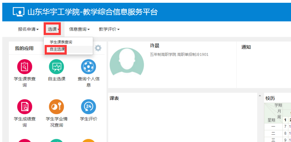
图 2 学生功能菜单界面

第二步： 登陆系统后，进入学生页面，选取【选课】菜单，进入自主选课系统，如图 2 所示。